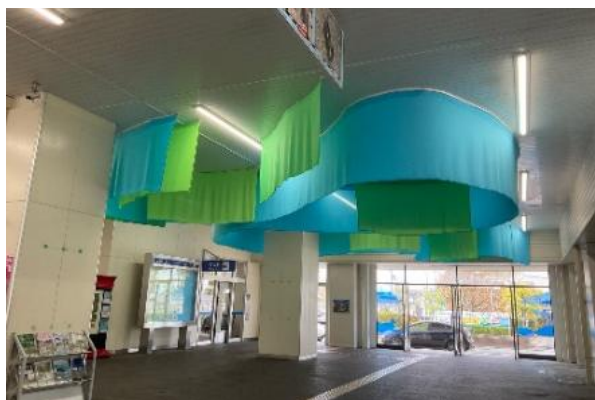
（近江今津駅での作品展示）

近江今津駅とマキノピックランドにて、学生とワークショップを開催し、メタセコイア並木をモチーフにしたアートを制作しました。その他にも駅構内に入り込む光や風を活かしたアートを制作し、近江今津駅にて展示しました。