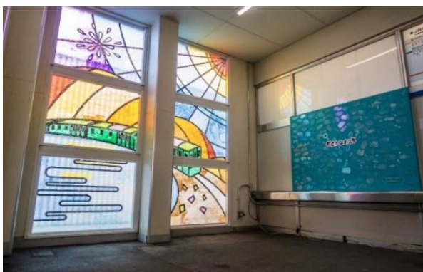
（近江舞子駅での作品展示）

ワークショップに参加された一般の方々と学生が一緒になり、「おさかなポスト」や「ステンドグラス風アート」を制作しました。完成した作品は、近江舞子駅改札口付近で展示しています。