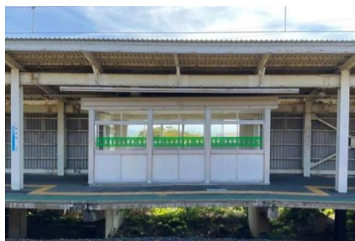
※イメージ（マキノ駅）