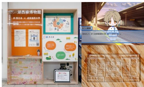
（《湖西線博物館》展示（左）、《ノベルゲーム『駅恋』》（右上）、《湖西線スタンプラリー》景品（右下））

湖西線開通 50 周年を記念し、学生が考案した 3 つの企画を実施しました。擬人化した駅名看板と会話する恋愛シミュレーションゲーム《ノベルゲーム『駅恋』》をリリースし、湖西線に関する情報展示ブース《湖西線博物館》を駅構内に設置。学生がスタンプや景品をデザインした《湖西線スタンプラリー》も実施しました。